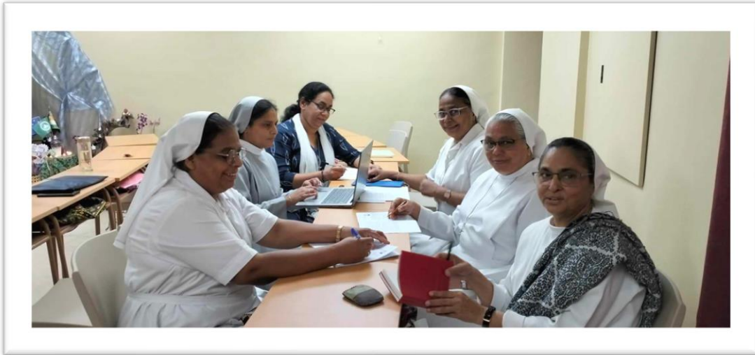
En el grupo 1 se lleva a cabo el trabajo seriamente.