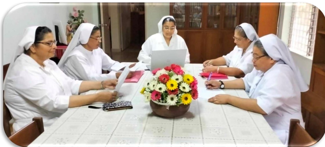
En el grupo 4 se lleva a cabo el trabajo seriamente.